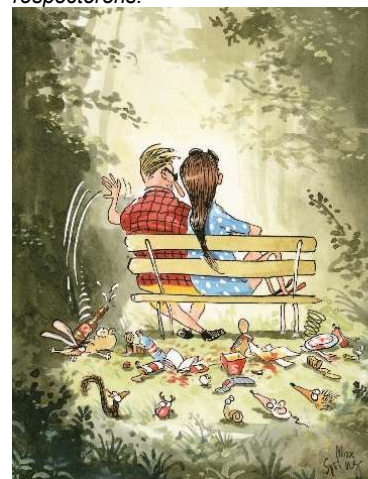
Ni traces ni déchets, nous ne laisserons.