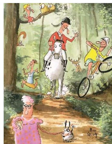
Les uns les autres nous nous respecterons.

Le petit guide est consultable et téléchargeable sur le site www.waldknigge.ch . Vous pouvez également y commander autant d'exemplaires que vous souhaitez. Le petit guide est un excellent outil pédagogique pour l'école. Pour plus d'infos sur la forêt : www.foretsuisse.ch