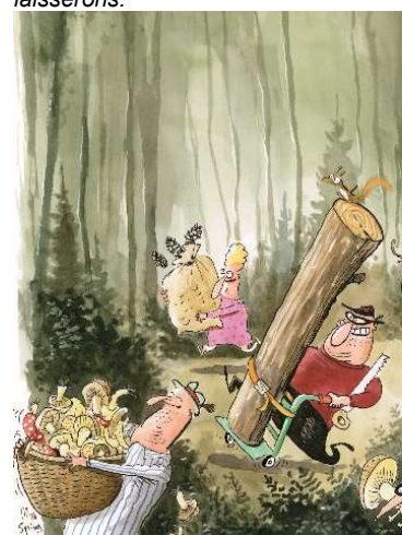
Fruits et récoltes, point nous n'amasserons.